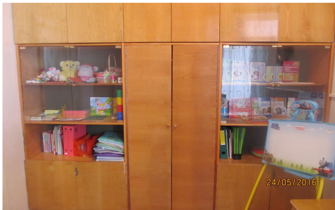
Шкаф для методических пособий